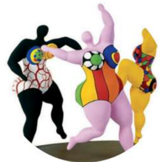
Niki de Saint Phalle