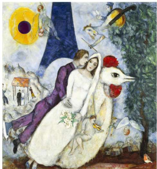
Les Mariés de la Tour Eiffel, 1939, Marc Chagall