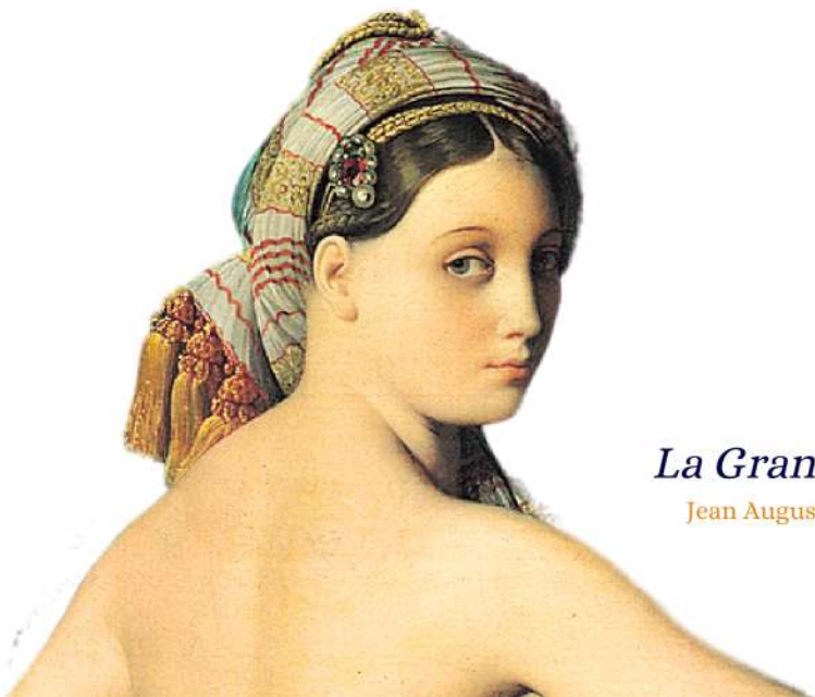
La Grande Odalisque